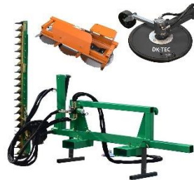
Skógarsnyrtir fyrir vinnuvél með klippum, sög og orfi. Vökvadrifð