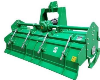
Hnífatætarei 230cm Öflugur tætarei fyrir traktora cat.2 70hp+ RPM 540 mesta vinnsludýpt 16cm, 60 hnifar. Einnig til 200cm.