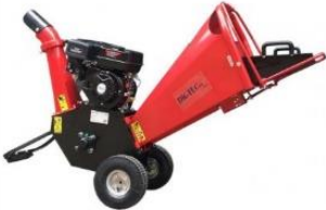
6,5hp kurlari fyrir 8cm sverar greinar