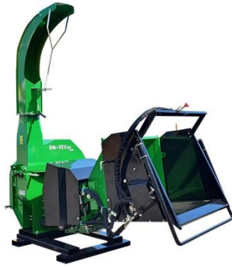
Kurlari PTO/Hydro* Hámark 25cm sverar greinar Aflþörf 90hp. Hydro merkir að innmötun er vökvadrifin