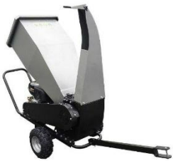
15hp EL kurlari fyrir 9cm sverar greinar