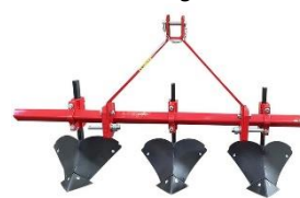
Hreykiplógur 2ja og 5 raða