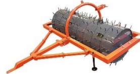
Tromlur í stærðunumm 150/180cm með eða án tinda.