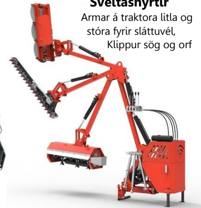
Sveitasnyrtir Armar á traktora litla og stóra fyrir sláttuvél, Klippur sög og orf