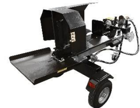
Viðarkljúfur 230V/ 400V/PTO eða bensín