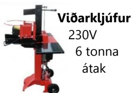
Viðarkljúfur 230V 6 tonna átak