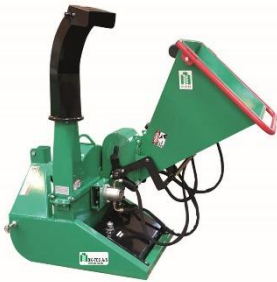
Kurlari PTO/Hydro Hámark 10cm sverar greinar. Aflþ. 20hp. Lokað glussakerfi