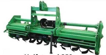
Hnífatætarei 250cm fyrir 90hp+ RPM540 fjórar hraðastillingar