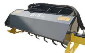
Hnífatætarei 147cm vökvadrifinn og hentar vel liðléttingum