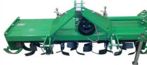
Hnífatætarei 180cm fyrir þritengið, cat.1, 350kg, fyrir 40hp+, RPM 540, mesta dýpt 15cm, 48 hnifar. Einnig 105, 125 og 150cm