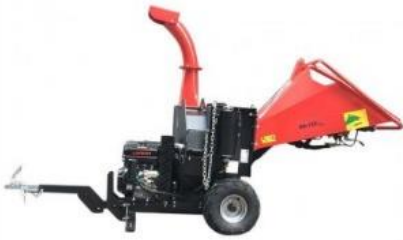
15hp EL kurlari hydro fyrir 12cm sverar greinar