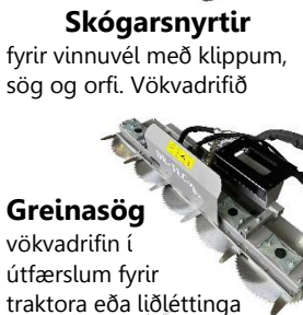
Greinasög vökvadrifin í útfærslum fyrir traktora eða liðléttinga