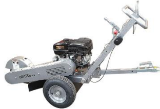
15hp EL Stubbataetari