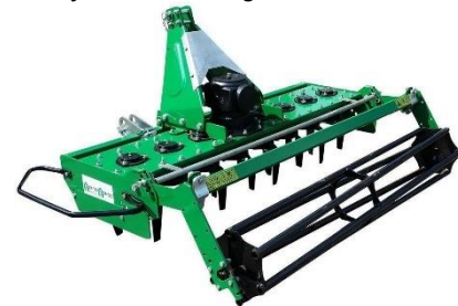
Pinnatætarar í ýmsum stærðum með eða án sáningarkassa PTO eða vökvadrifð