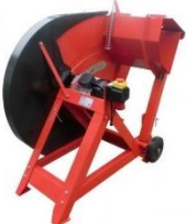
Raftasög 400V 70cm sagarblað