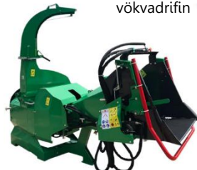
Kurlari PTO/Hydro Hámark 14,8/17,8cm sverar greinar. Aflþörf 25/50hp