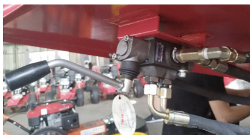
Håndtag til fødetragt