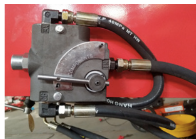
Ventil med skala