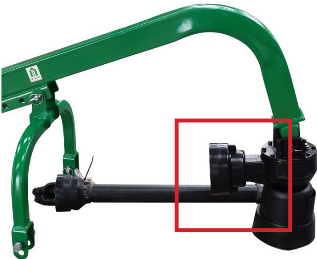
Montering af jordbor (følger ikke med køb af basisenheden)