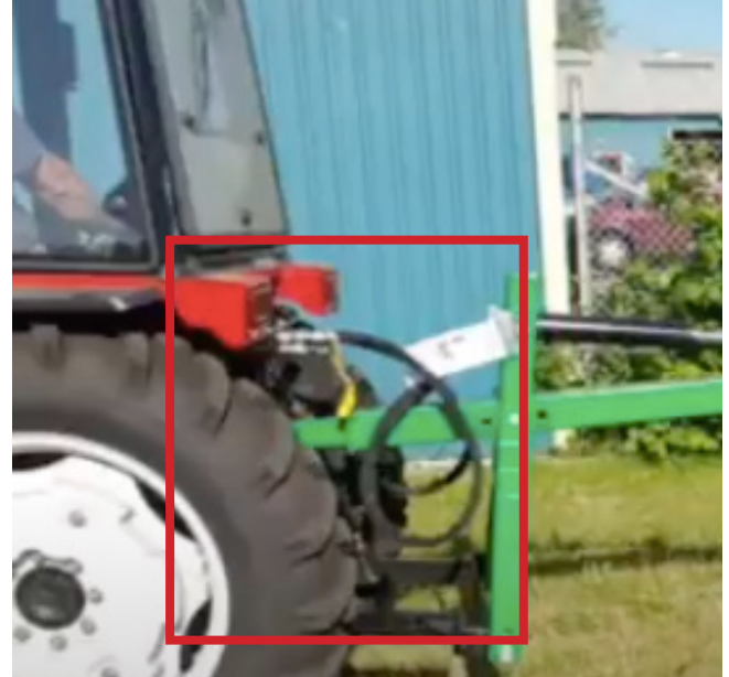
For modeller med hydraulisk tryk: Tilslut hydraulikslangerne, kræver dobbeltvirkende hydraulik ventil