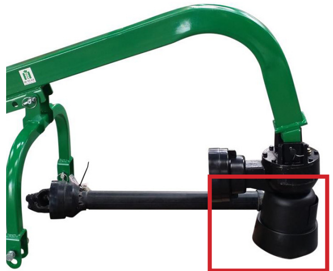
Montering af PTO aksel