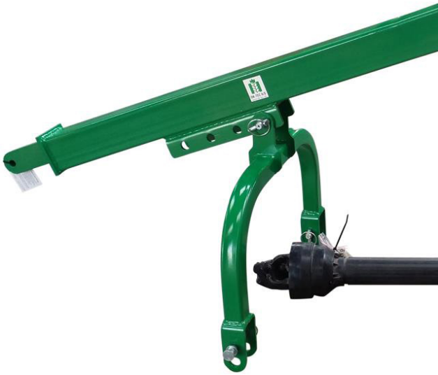
Montering af jordboret på traktorens trepunktsophæng