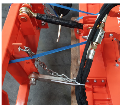
Topstang til justering af vinkel på ramme mod minilæsser