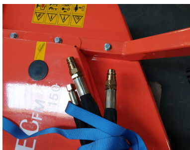
Hydraulikslanger – tilsluttes minilæsser:

Følg alle sikkerhedsforanstaltningerne beskrevet i denne manual.